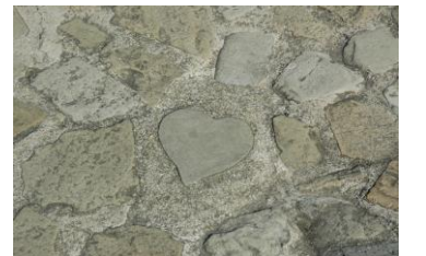
グラバー園で人気のハートストーン

⇒ 鍋冠山からの夜景 鍋冠山は標高169mです 展望台からは長崎港を一望ことができ、その眺めは長崎で一二を争う美しさです